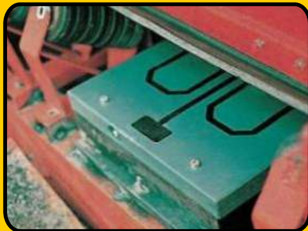
Sonda simples QLC instalada

Todos os componentes elétricos são colocados dentro de um painel de controle. Eles são mantidos fora da sonda e, portanto, são protegidos contra projeção de pedras, além de possuir fácil manutenção. Todos os controles de operação são manuseados facilmente na parte frontal do painel.