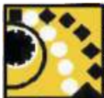
Separador magnético de suspensão